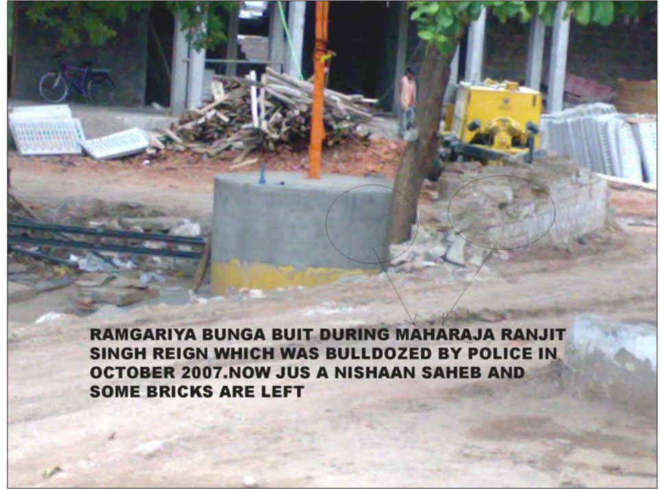
RAMGARIYA BUNGA BUILT DURING MAHARAJA RANJIT SINGH REIGN WHICH WAS BULLDOZED BY POLICE IN OCTOBER 2007. NOW JUST A NISHAAN SAHEB AND SOME BRICKS ARE LEFT