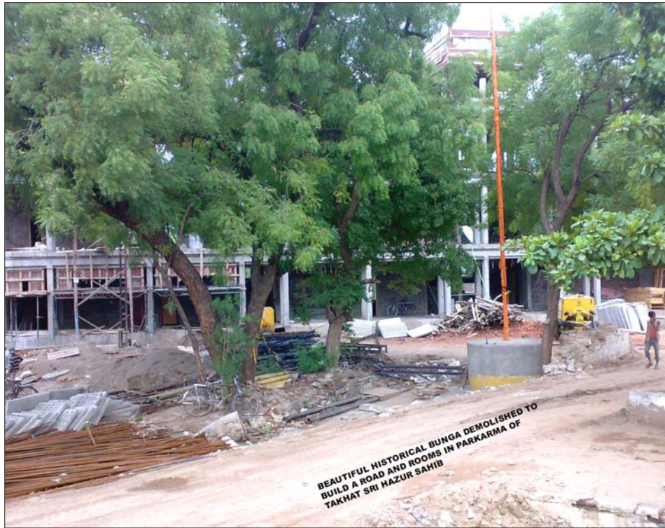
BEAUTIFUL HISTORICAL BUNGA DEMOLISHED TO BUILD A ROAD AND ROOMS IN PARKARMA OF TAKHAT SRI HAZUR SAHIB