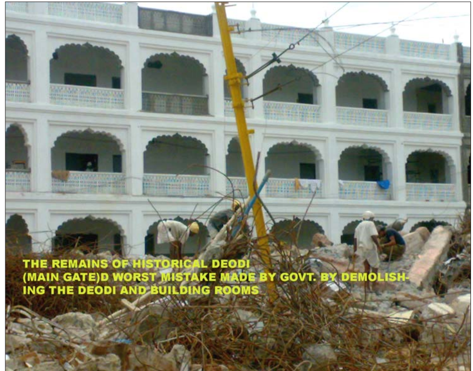
THE REMAINS OF HISTORICAL DEODI (MAIN GATE)D WORST MISTAKE MADE BY GOVT. BY DEMOLISHING THE DEODI AND BUILDING ROOMS