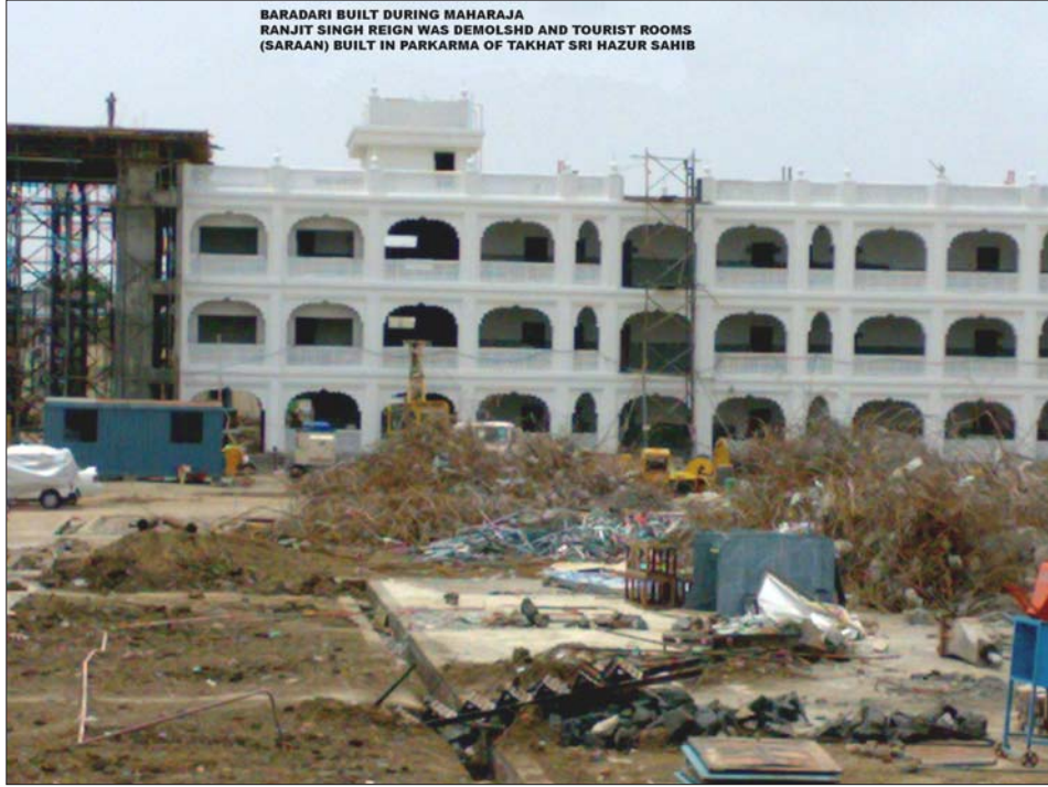
BARADARI BUILT DURING MAHARAJA RANJIT SINGH REIGN WAS DEMOLISHED AND TOURIST ROOMS (SARAAN) BUILT IN PARKARMA OF TAKHAT SRI HAZUR SAHIB